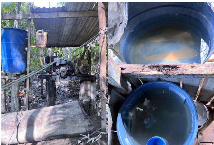
Figura 5. Água utilizada para os demais serviços domésticos na Ilha das Onças

Os estudos de Schallenger (2010) e Rodrigues (2015) sobre a área revelaram ainda as dificuldades no acesso à água potável disponibilizada pelo governo local. De acordo com os moradores da Ilha das Onças, o abastecimento ocorre por meio de barqueiros contratados pela prefeitura de Barcarena, responsáveis pela entrega de galões de água às comunidades. Nos relatos apresentados durante a vivência na comunidade foi informado que cada família recebe dois galões de 5 litros, distribuídos duas vezes por semana, e que para as demais atividades, a água utilizada é proveniente do próprio igarapé (Figura 5 abaixo). No entanto, não há garantias quanto à frequência e à qualidade do recurso.