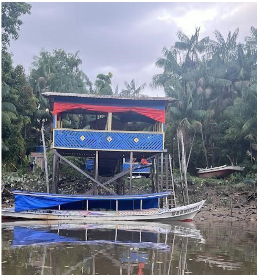
Figura 3. Moradias ribeirinhas, Ilha das Onças - PA

palafitas, também carregam as características da cultura e da paisagem regional. Abaixo, na Figura 3, podemos observar as moradias tipicamente ribeirinhas.