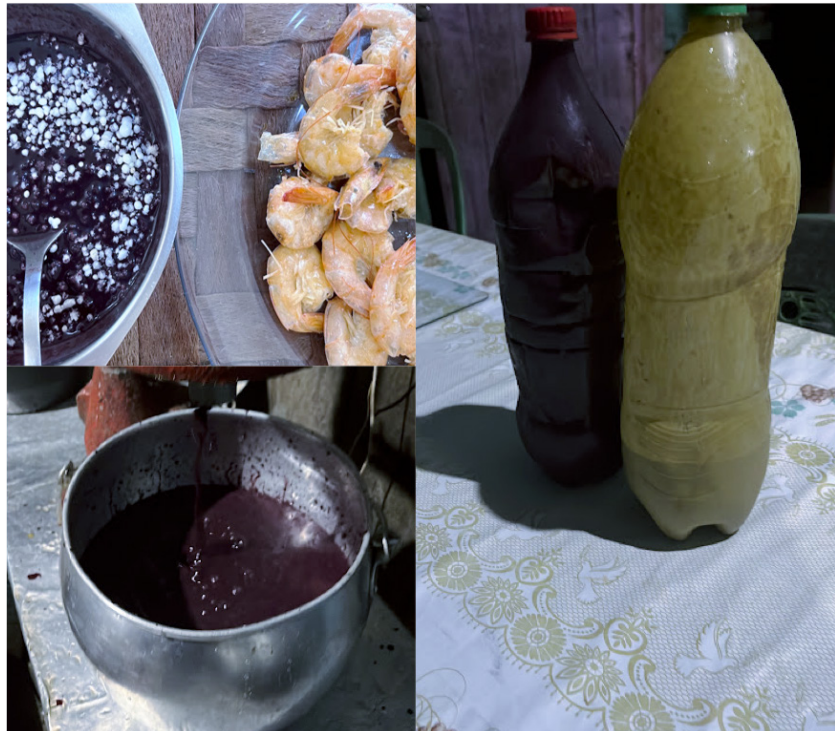
Figura 7. Alimentação tipicamente ribeirinha com açaí e pescados