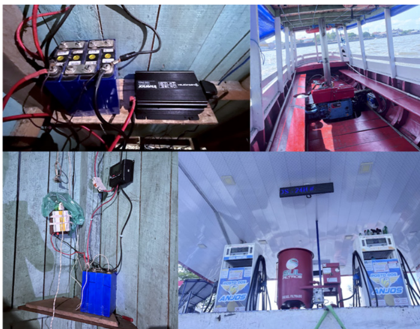
Figura 6. Formas de energia elétrica na Ilha das Onças

A Ilha das Onças, que não está conectada ao Sistema Interligado Nacional, é pouco atendida por sistemas isolados, dependendo de combustíveis fósseis para o transporte e a geração de energia elétrica. Na Figura 6 abaixo, pode-se observar as formas de energia supracitadas.