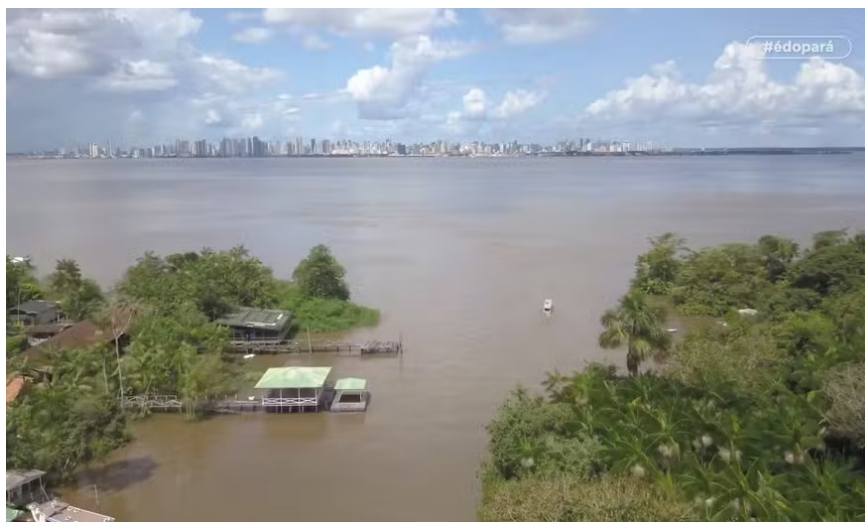
Figura 2. Furo Grande, Ilha das Onças - PA

A chegada à ilha ocorre somente via fluvial, pelos meandros do canal do Rio Piramanha, o mais importante da região e rota diária para inúmeras embarcações que transportam passageiros (Torres, 2010). O percurso até à comunidade Piramanha Baixo, na Ilha das Onças, foi marcado pela contemplação da beleza da região e por diálogos profundos com a interlocutora. Ao longo do trajeto, observam-se os meandros do rio, surgem casas de madeira, trapiches e famílias numerosas. Abaixo, na Figura 2, pode-se observar um dos canais principais do Rio Piramanha, o Furo Grande.