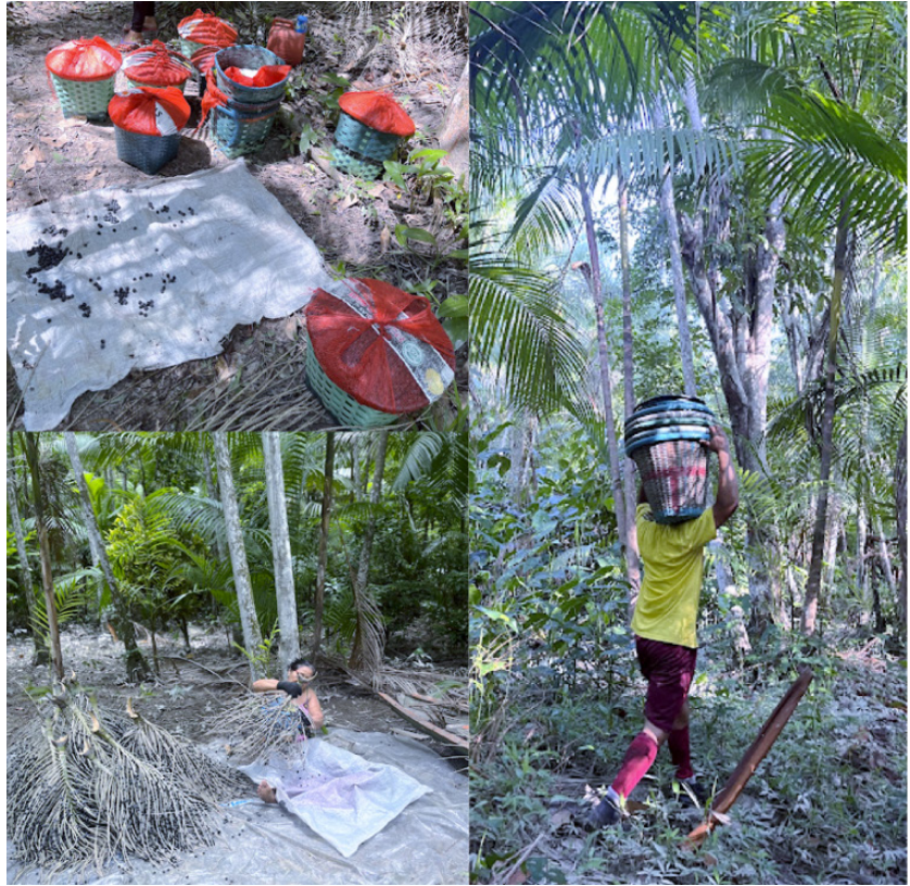
Figura 9. Açai na Ilha das Onças