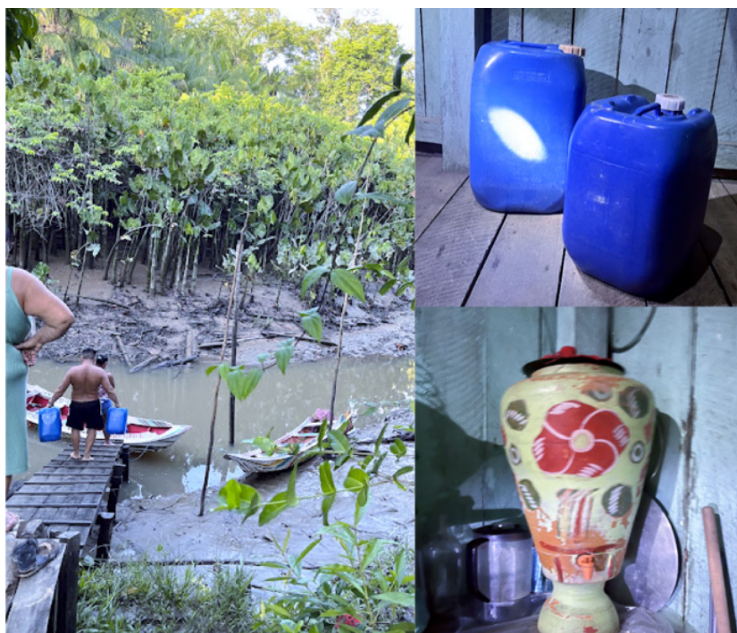
Figura 4. Água potável na Ilha das Onças

A Pesquisa Nacional de Saneamento Básico, realizada em 2018 pelo Instituto Brasileiro de Geografia e Estatística (IBGE, 2018), evidenciou que a região amazônica brasileira continua apresentando o maior déficit nacional em termos de abastecimento de água. Indicou ainda que cerca de 54,7% dos domicílios amazônicos não têm acesso à rede geral e, apenas 10,5% dos municípios da região possuem formas alternativas de abastecimento de água. Essa realidade é ainda mais grave quando se trata das populações tradicionais, pois as áreas rurais são as mais afetadas pelas consequências da precariedade do saneamento. A Figura 4 abaixo apresenta as condições de recebimento e armazenamento de água na comunidade ribeirinha estudada.