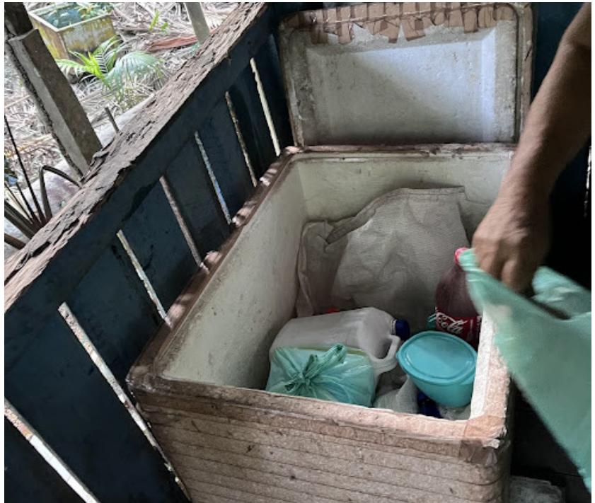
Figura 8. Armazenamento de alimentos na Ilha das Onças